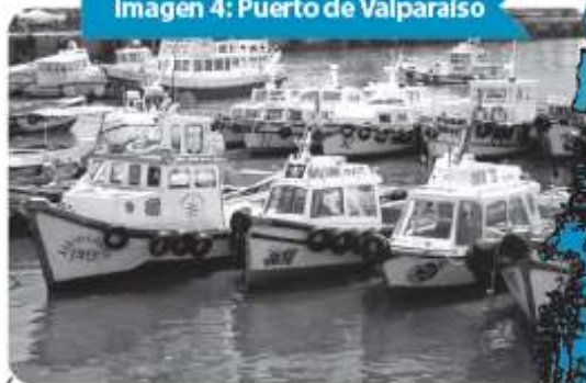
Imagen 4: Puerto de Valparaíso