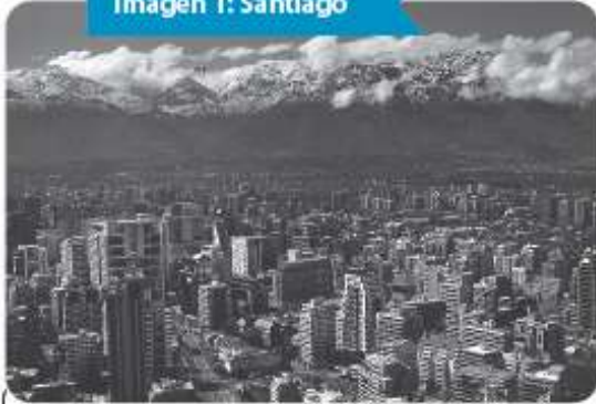
Imagen 1: Santiago

Actividad 3: Observa las siguientes imágenes y determinan a qué zona geográfica pertenecen (norte, centro o sur) y las ventajas y desventajas de ese paisaje en particular.