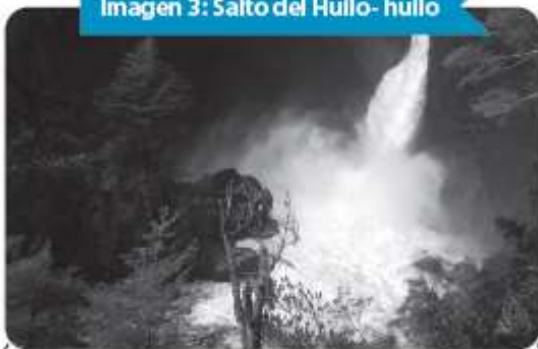
Imagen 3: Salto del Hullo- hullo