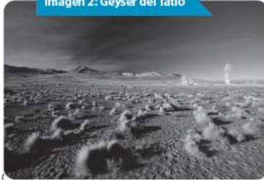
Imagen 2: Geysir del Tatio